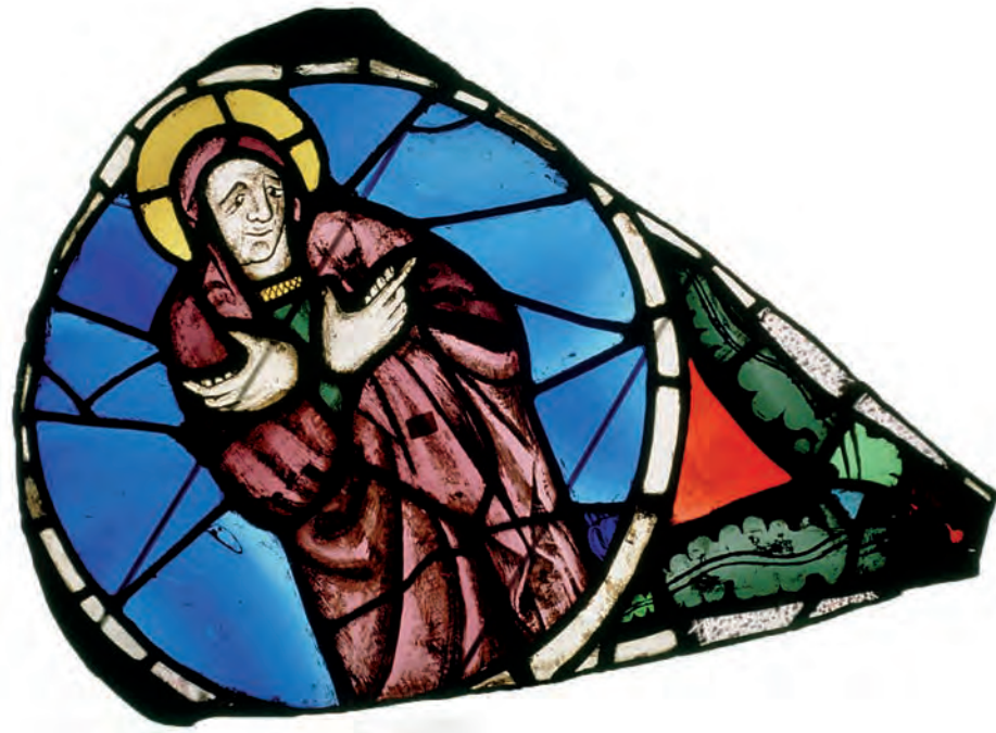
SU 94: lòbul 8