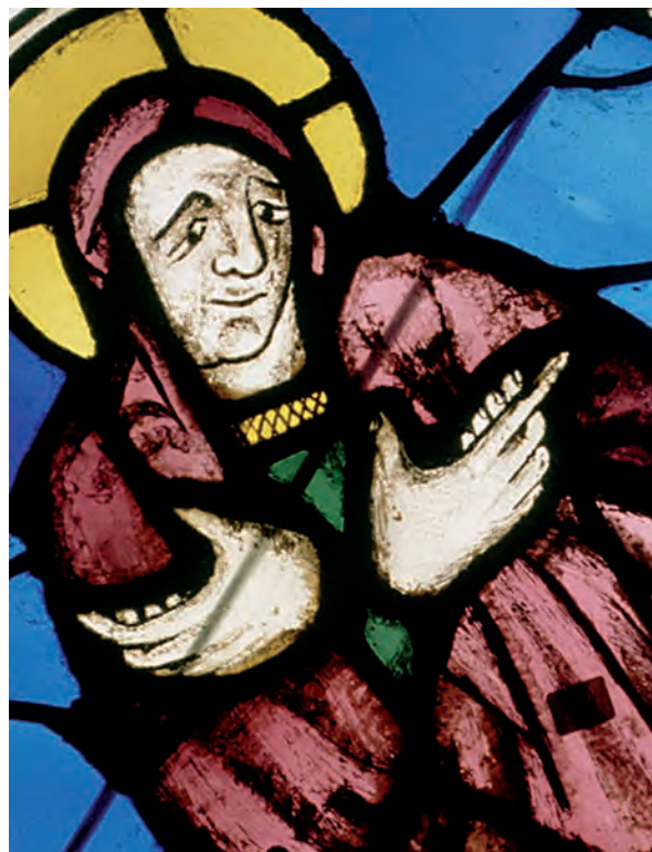
SU 94: lòbul 8 (detall)