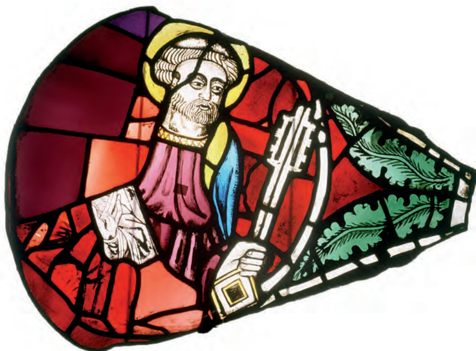
SU 93: lobul 7