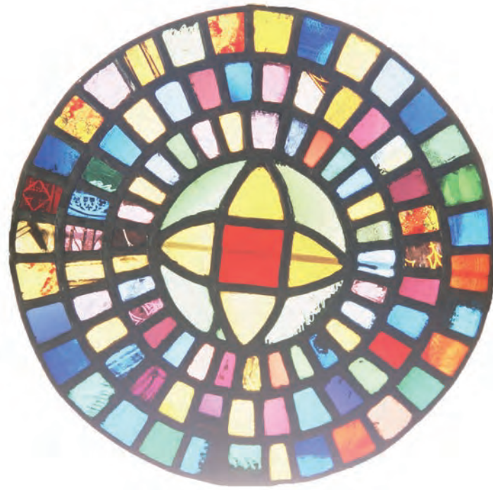
SU 85: òcul central