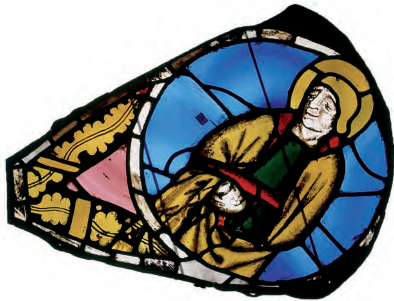
SU 87: lòbul 2