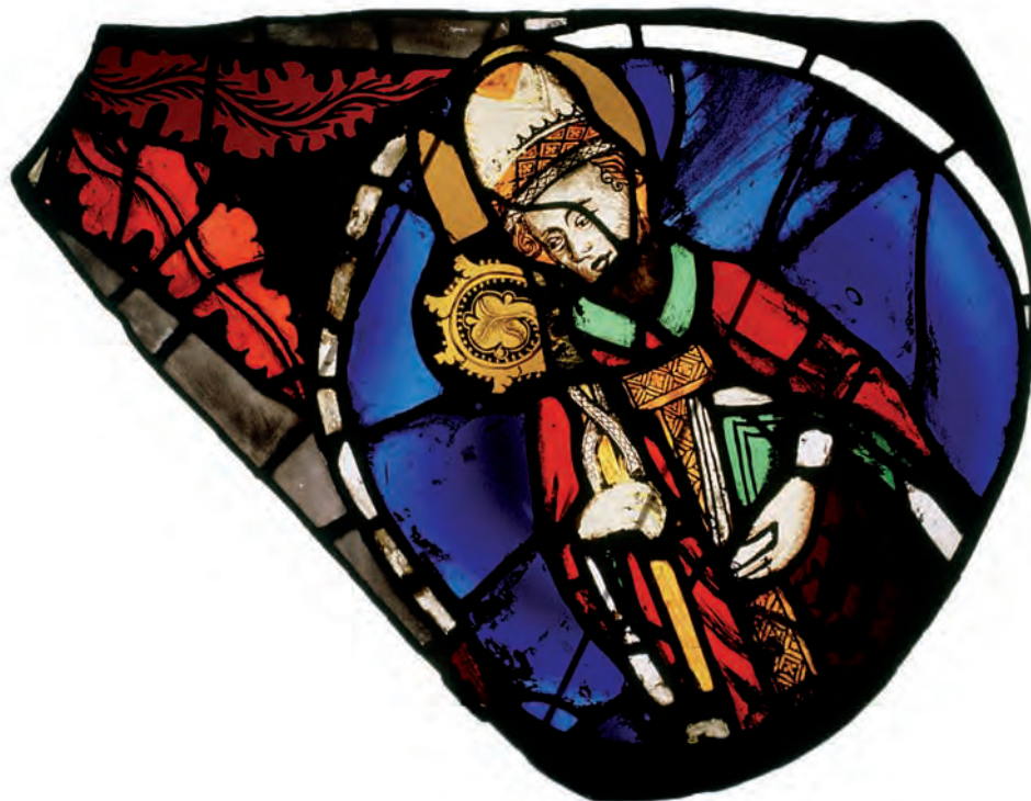
SU 89: lobul 4