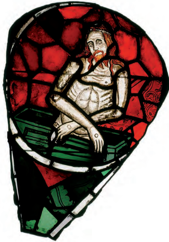
SU 86: lòbul 1