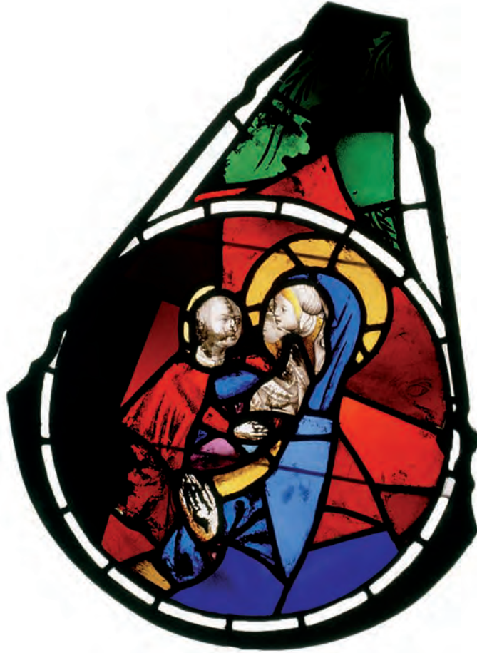
SU 90: lòbul 5