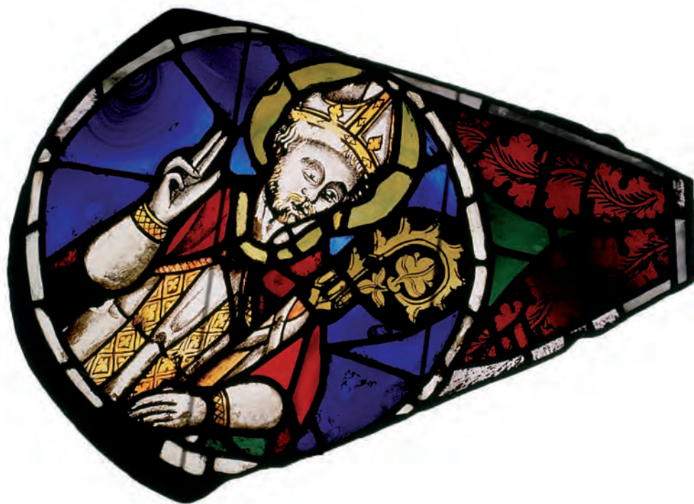
SU 92: lobul 6