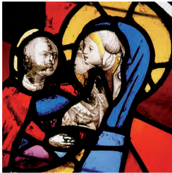
SU 91: lòbul 5 (detall)