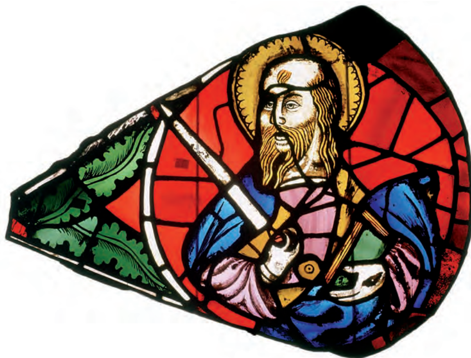
SU 88: lobul 3